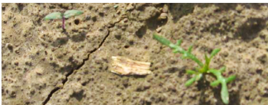
Avec les températures élevées, une première levée d'adventices est observée sur les labours

Le désherbage en pré-levée est utile dans certaines situations pour contrôler une ou des flore(s) bien spécifique(s) telles que les graminées (vulpin et ray-grass), les ombellifères (éthuse et ammi majus), les matricaires et les renouées des oiseaux.